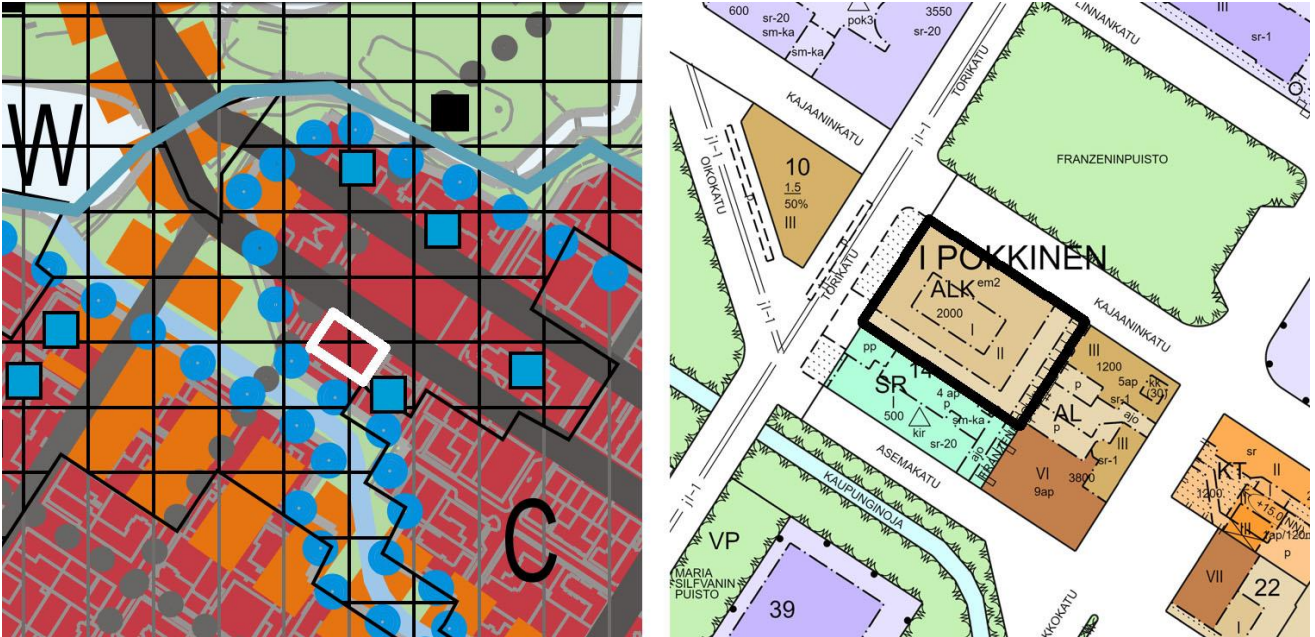
Kuvat 2 ja 3 Otteet voimassa olevasta yleiskaavasta ja asemakaavasta

ominaisluonteen ja erityispiirteiden säilyminen. Rakennettuun kulttuuriympäristöön vaikuttavista hankkeista on pyydetty lausunto museoviranomaiselta.